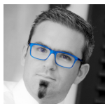
Philipp Diebold Bagilstein GmbH https://www.bagilstein.de